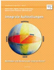
Integrale Aufstellungen Methoden und Modelle der Inneren Form