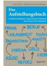
Das Aufstellungsbuch Familienaufstellung, Organisationsaufstellung und neueste Entwicklungen