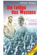
Die Leiden des Westens – eine Faktion eine Aufarbeitung der beiden Weltkriege

Wir freuen uns sehr über den Abschluss der ersten Ausbildung der Integral-Systemics-Coaches in Bern – die 3. In der Schweiz! Im Januar 2019 haben elf Schweizer - von Homöopathen über Betriebswirte bis hin zu einer Musikredakteurin - die qualifizierte und fundierte Ausbildung in Systemischer Beratung & Coaching (Business & Personal) erfolgreich absolviert.